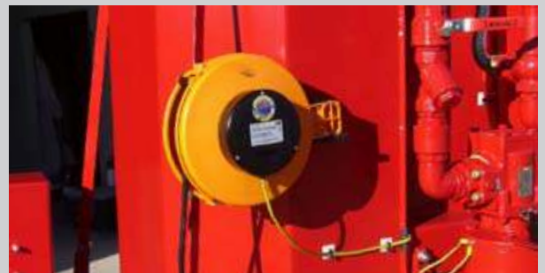
E) Potentialausgleich mit Kabeltrommel und Stecker