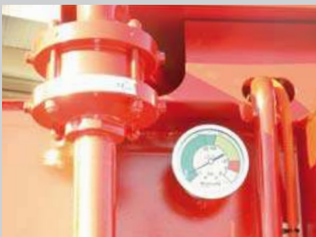
H) Flammensperre (Ex-Ausstattung)