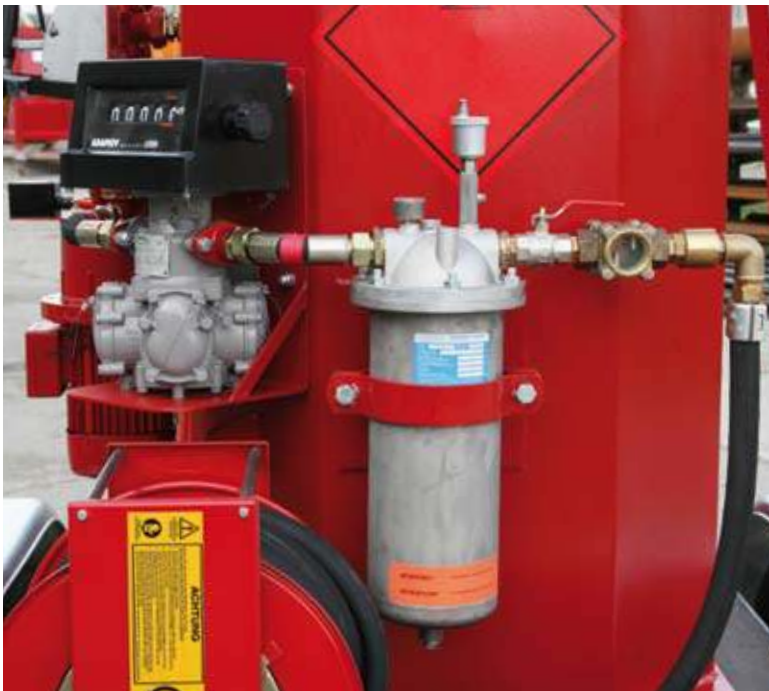
C) Kraftstofffilter mit Wasserabsorber und Entlüfter