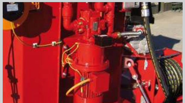
A) Robuste Kraftstoffpumpe 50 Ltr./min.