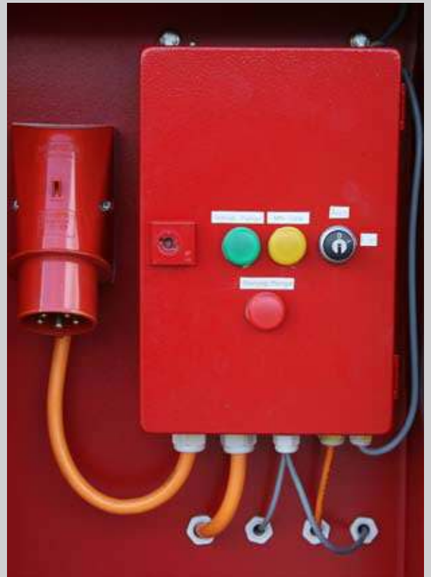
G) Steuerung mit Fremdversorgung AC 400V 32A