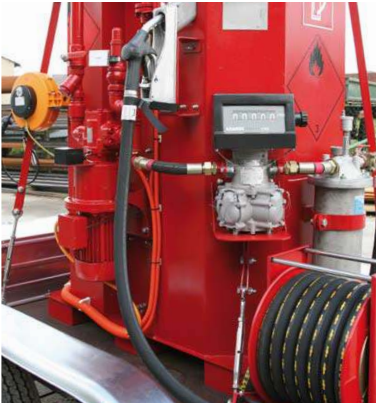
A, B, C, D) Zapfanlage 50 Ltr./min.