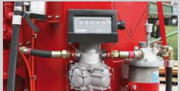
B) Zählwerk eichfähig, geeignet für Flugkraftstoffe