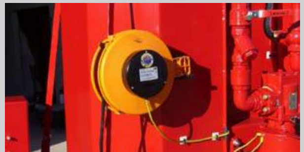
E) Potentialausgleich mit Kabeltrommel und Stecker