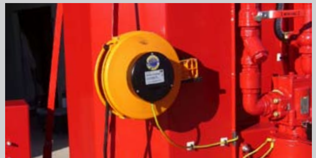
E) Potentialausgleich mit Kabeltrommel und Stecker