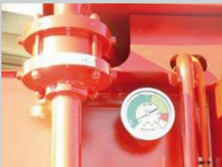
H) Flammensperre (Ex-Ausstattung)