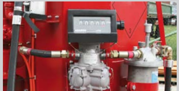
B) Zählwerk eichfähig, geeignet für Flugkraftstoffe