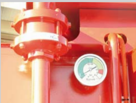
H) Flammensperre (Ex-Ausstattung)