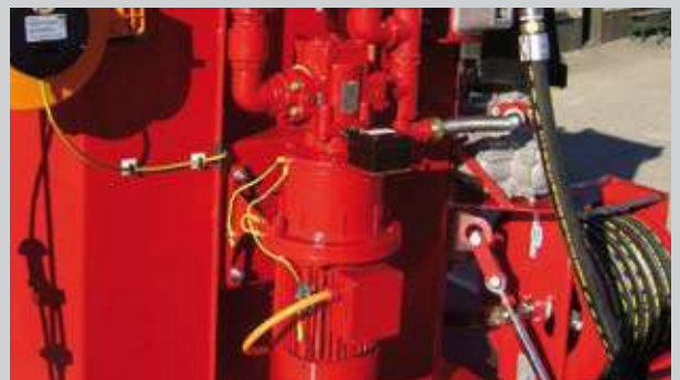
A) Robuste Kraftstoffpumpe 50 Ltr./min.