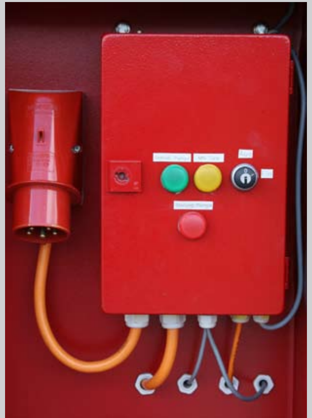
G) Steuerung mit Fremdversorgung AC 400V 32A