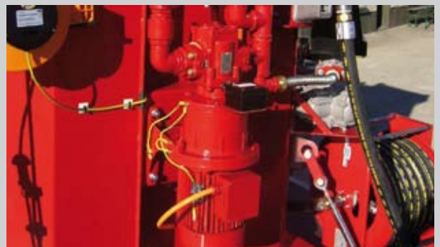
A) Robuste Kraftstoffpumpe 50 Ltr./min.